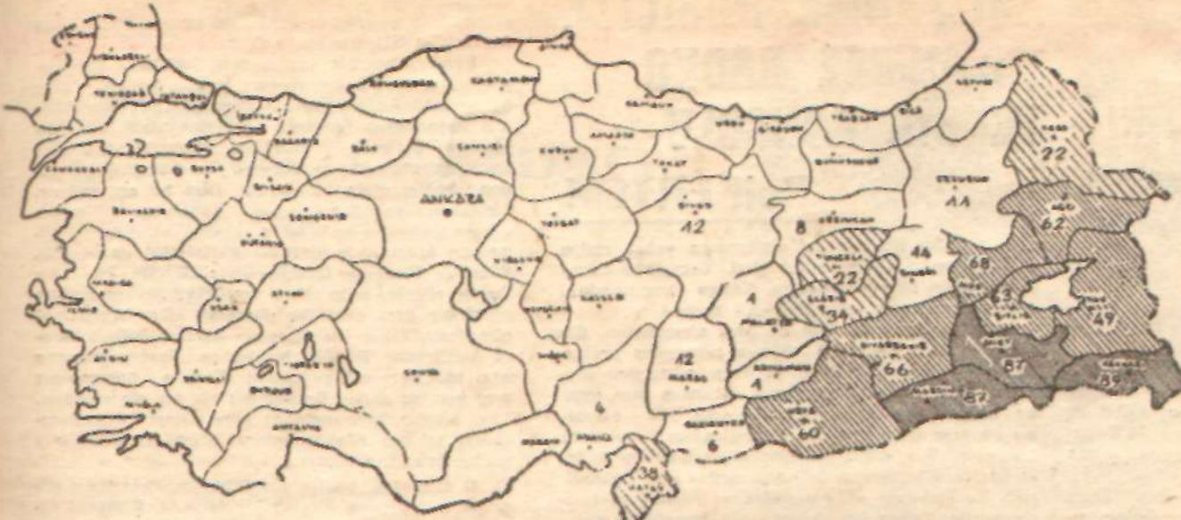
harita : 1