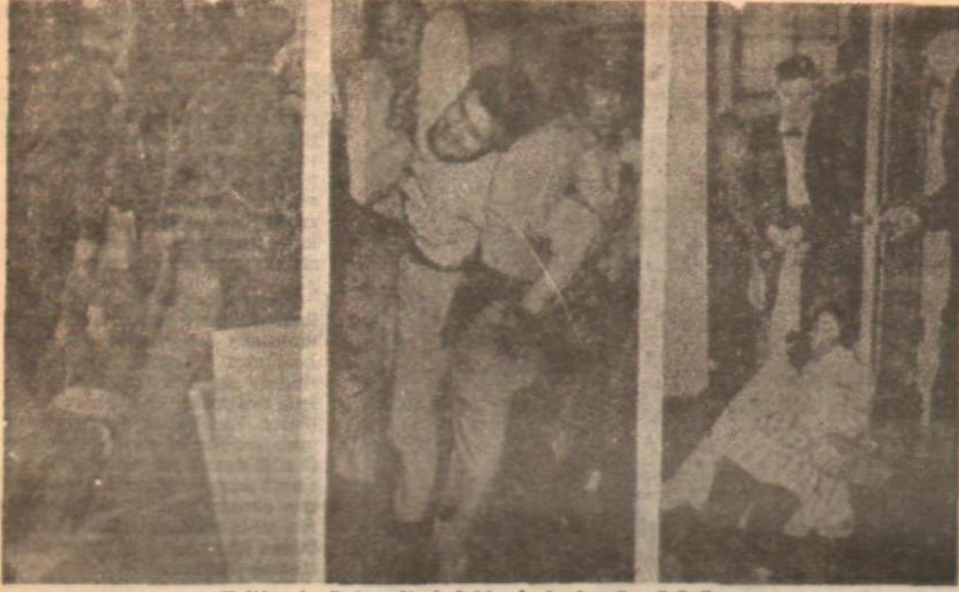
Kalifornia Üniversitesindeki olaylardan üç görünüş.