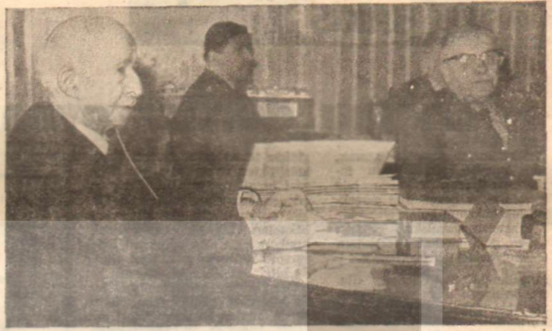
Başbakan İnönü ve Orgeneral Cevdet Sunay

Daha sonra konuşan Feyzioğlu da bu görüşü teyid etti. Gençlik