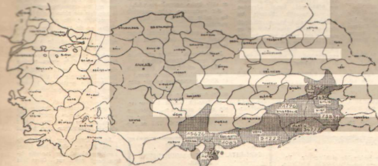
harita : 3

siyasetinin 26 köyünden 9 u Alevi köyü, 17 si Sünni köyüdür.