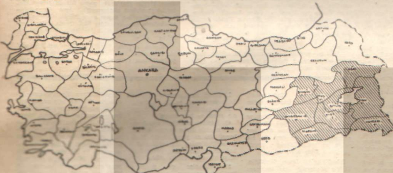
harita : 2