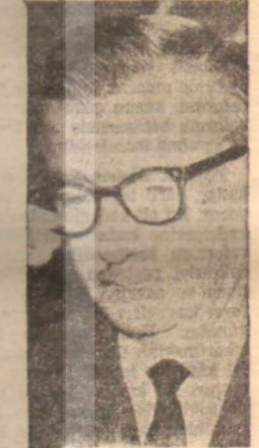
İsmail Rüştü Aksal Muteber lider

da Turhan Feyzioğlu» diye söz ediyordu. Feyzioğlu henüz bey ünvanını kazanamamıştı.